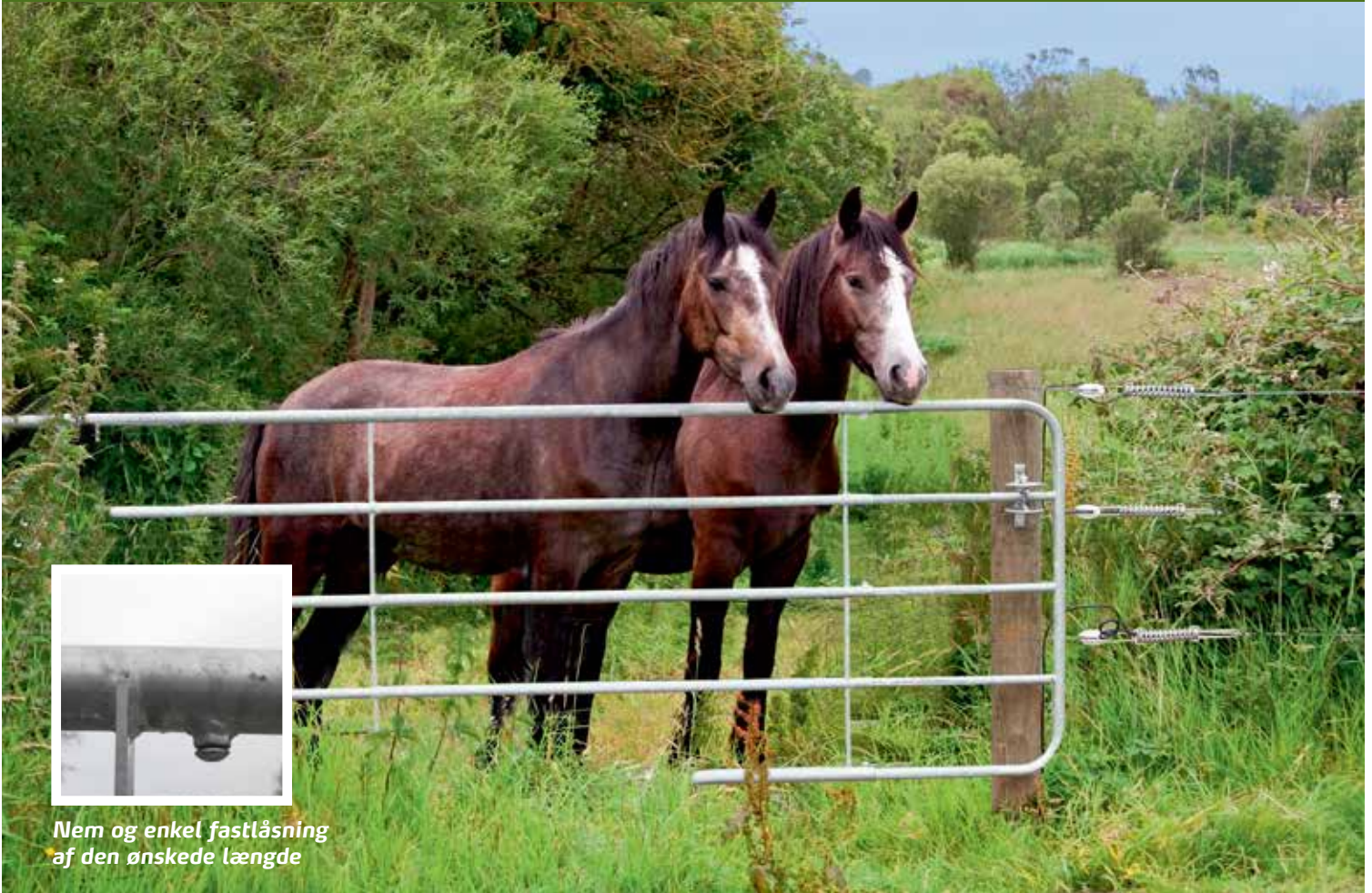
Nem og enkel fastlåsning af den ønskede længde