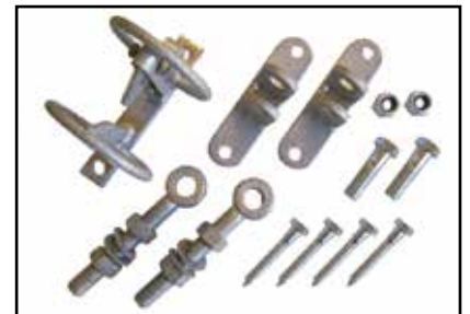
Vnr. 59032: Komplet beslagpakke.

Til Teleskoplågerne fås en komplet beslagpakke med kraftige 20mm justérbare hængsler og stabler. Et sikkerhedsglipfald med beskyttelsesbøjler er inkluderet i beslagpakken.