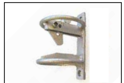
Sikkerhedsglipfaldets runde bøjler reducerer risikoen for skader på dyrene.